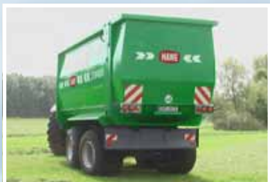
HAWE CSW 4000 mit hydraulisch gefedertem Tandem-Fahrwerk, inkl. Liftachse und Nachlauf-Lenkung.