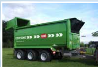
HAWE CSW 5000 mit parabelgefedertem Tridem-Fahrwerk mit Nachlauf-Lenkung für die erste und die dritte Achse, Zwangslenkung optional.